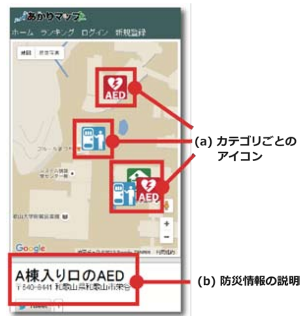
図-4 提供される詳細な防災情報の画面例