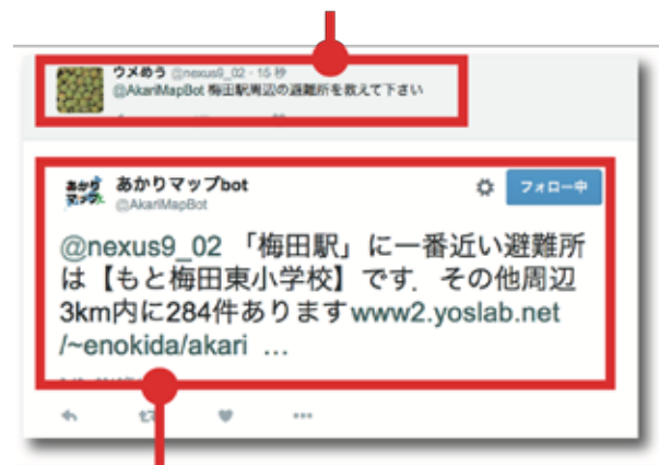
(b) あかりマップ bot からの周辺の防災情報の提供