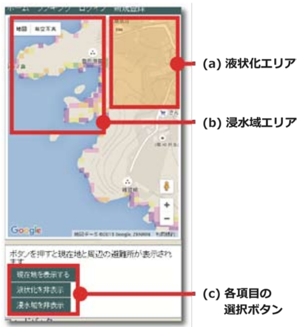
図-5 浸水域エリアと液状化エリアの表示例

エリアの情報を閲覧可能である。画面内のマップ上に表示されている図-5(a)が液状化エリアを示し、図-5(b)が浸水域エリアを示している。画面上の「液状化」および「浸水域」の表示・非表示ボタン(図-5(c))を選択することで、各情報の表示と非表示を切り替えることができる。