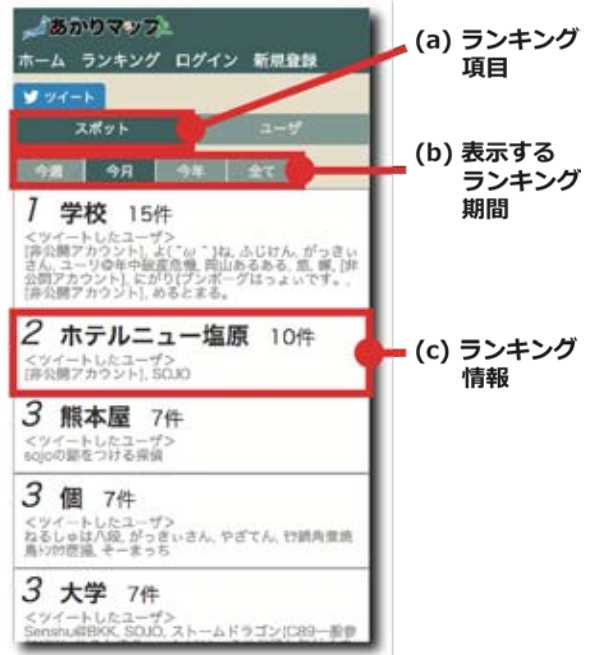
図-6 スポットランキングの画面例

画面内の「スポット」(図-6(a))を選択することで表示される。「スポット」は、ツイートに含まれていた位置表現のことを指す。スポットランキングは、期間中あかりマップbotの全フォロワーが訪れたとして推測されるスポットの件数で順位付けを行っている。ランキング情報(図-6(c))には、スポット名、スポットが含まれるツイートの件数、スポットを含むツイートを発信したユーザ名を表示している。なお、Twitterのアカウント設定を非公開にしている場合、ユーザ名は表示してい