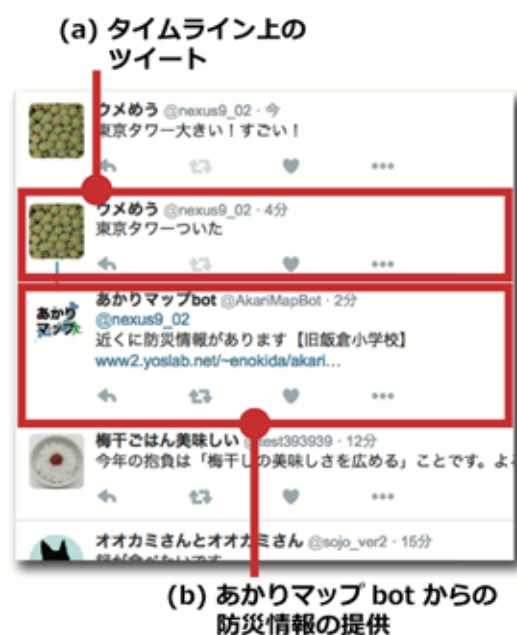
図-2 タイムライン上のツイートへの応答例