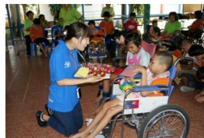
(4) おもちゃを受け取る子ども