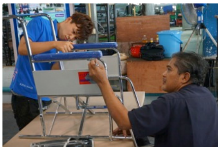
(1) 車いす組み立ての様子

1つめは、車いすの組み立てと寄贈です。組み立ては、現地の工場で実際に私たちの手で、現地スタッフと協力して行いました。これらの車いすの資金は先述の通り国内でのチャリティ活動で集まったものです。その完成はまさに、協力してくださった方々の思いが、形となる瞬間であったということが出来ます。そして、その車いすを翌日から2日間に渡り、2つの施設で子どもたちに寄贈しました。またその内2人の子どもたちの自宅へは、彼らの自宅への訪問と、インタビューで家族からお話をさせていただく貴重な機会を得ることもできました。