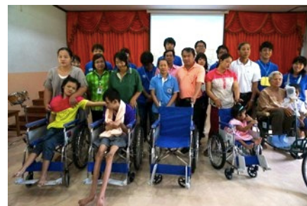
2) 車いす贈呈式の様子

2つめは、子どもたちとの交流です。活動期間訪れた3つの施設で私たちは様々な障害を抱える子どもたちとの交流企画を実施しました。子どもたちが経験したことのない遊びを実施しようと考え、竹とんぼ、紙風船などの日本の昔遊びを提供することにしました。言葉の伝わらない環境でも子どもたちは十分にそれを楽しんでくれて、WAP 全体のテーマである「笑顔」をたくさん見ることができました。最後に、これからも楽しんでもらえるようおもちゃを子どもたちに寄贈し、3回に渡る交流企画はすべて成功しました。