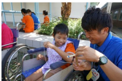
(3) 竹とんぼを楽しむ子ども

2つめは、子どもたちとの交流です。活動期間訪れた3つの施設で私たちは様々な障害を抱える子どもたちとの交流企画を実施しました。子どもたちが経験したことのない遊びを実施しようと考え、竹とんぼ、紙風船などの日本の昔遊びを提供することにしました。言葉の伝わらない環境でも子どもたちは十分にそれを楽しんでくれて、WAP 全体のテーマである「笑顔」をたくさん見ることができました。最後に、これからも楽しんでもらえるようおもちゃを子どもたちに寄贈し、3回に渡る交流企画はすべて成功しました。