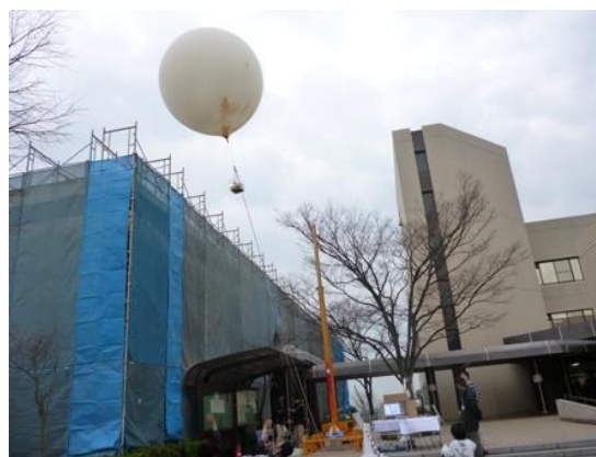
図 6 係留バルーンとランチャー

2012年12月15日・16日に和歌山大学で開催されたおもしろ科学まつり・自主研究フェスティバルに参加した。おもしろ科学まつりとは、子どもたちに科学を楽しく体験してもらうものであり、自主演習フェスティバルとは、和歌山県下の学生を対象とした成果発表と情報交換の場である。どちらとも年齢に関係なく誰でも見学することが可能であり、さまざまな方に WSP の活動紹介ができた。WSP の展示内容としては、所有するロケット打上用のランチャー・放球用のバルーン