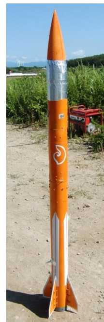
図 5 WP-2 号機

の技術（機体を設計通りつくること、エンジンの地上における実際の燃焼実験からその推力を求められるようになること等）を最低限獲得しなくてはならない。一方で、プロジェクトの運営面においては、実験報告書に関して不備があり、工程管理などでも反省すべき点が多くなったため、今後は今回の打ち上げ実験での反省点を活かし、計画的にプロジェクト運営を行うことに努めていく。