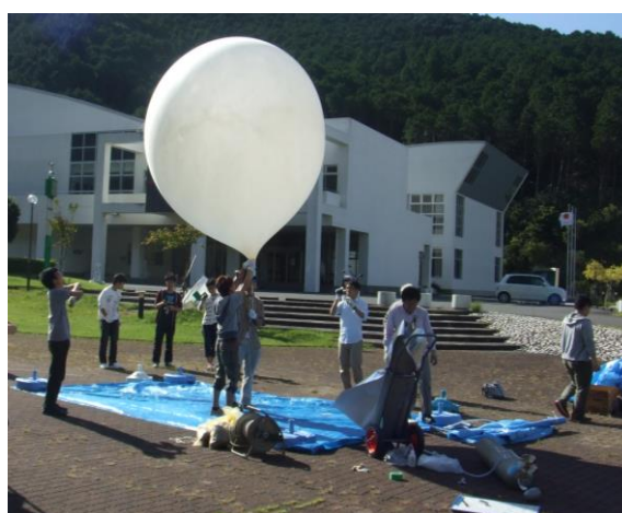
図 2 バルーンの放球準備中