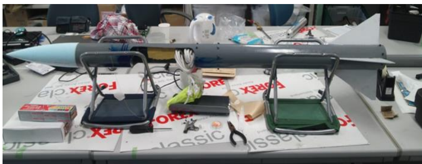
図 4 WP-1号

開放機構（電熱線でテグスを焼き切るタイプ）については、メインスイッチの入れ忘れにより動作しなかった。改善点として、機体整備についても手順書やチェックリスト等を作成する必要がある。一方、燃料グレイン爆発後にスイッチを入れたところ正常に動作したことから、かなりの衝撃にも耐えることができると分かった。そのため、能代宇宙イベントで打ち上げる機体にもこの方式を採用することにした。また、作業の殆どを経験がない一年生が行ったこともあり、全体的に計画性が無かったので、今後はより計画的に機体の製作を進めるようにする。