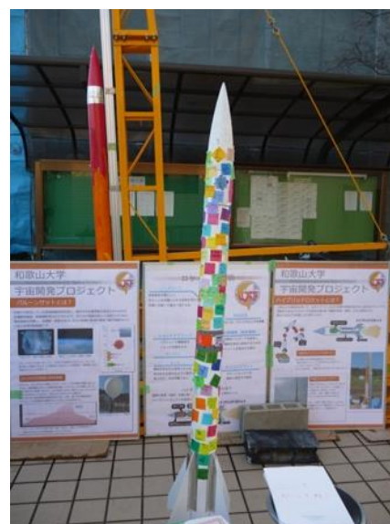
図 7 ロケットと説明ポスター

反省点としては、他の団体の展示には実際に体験して楽しむようなものが多かったが、WSPは体験するものが少なかったため、2013年度はこの点を改善しようと考えている。また2012年度は、おもしろ科学まつりと自主研究フェスティバルが例年と違い同時開催となったため、それぞれの情報が混ざってしまい、その結果自主研究フェスティバルの当日の参加者受付に遅れてしまった。よって、2013年度も同時開催になった場合は、それぞれの担当者を決めることによって、情報の混乱を避けることが必要であると感じた。