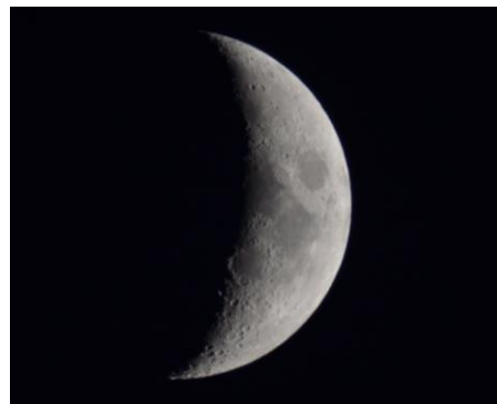
望遠鏡を通して見た月齢5の月