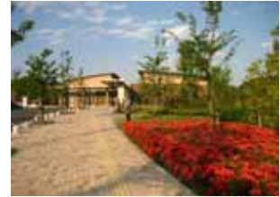
【岩出市岩出図書館】