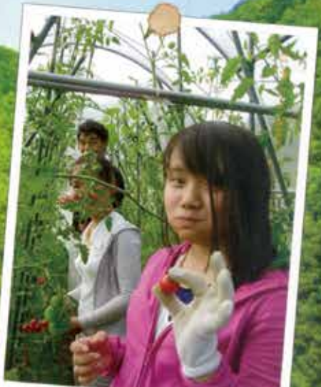
家の前の畑で野菜を収穫。収穫した野菜は晩ご飯のおかずになります。