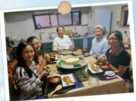
家族みんなでご過ごす夕食。忘れられていた日本の家庭がそこにはあります。