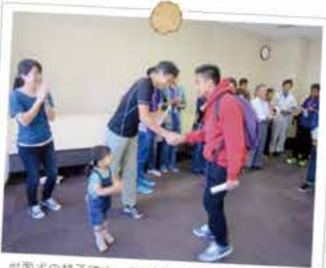
対面式の様子です。お世話になるお父さん、お母さんとの初めての出会いです。

受入家庭の皆さんも、家族や親戚が遊びに来たつもりで受入していますので、遠慮なく積極的に交流してください。