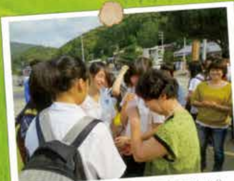
お別れ式の様子です。楽しい時間を過ごした分、お別れは留しくなります。