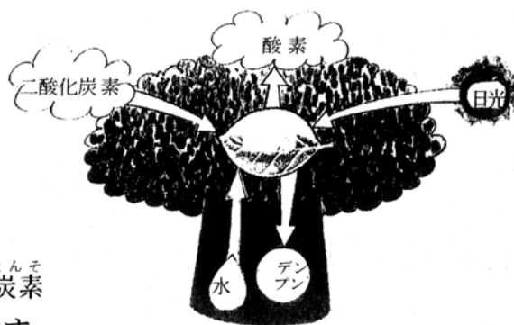
光 合 成 の し く み

木が家や家具などで利用されていると、その木に二酸化炭素が、とじこめられています。その二酸化炭素の量は、乾燥した木の重さの約2分の1と言われます。