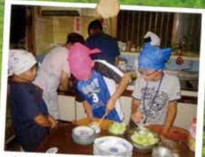
晩ご飯のお手伝いもしました。自分たちで作った食事は美味しいですよ。