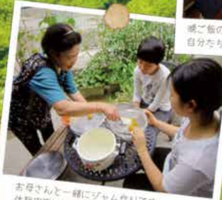
お母さんと一緒にジャム作りです。体験内容は各家庭ごとのお楽しみです。