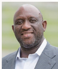
ウスビ・サコ 京都精華大学 学長