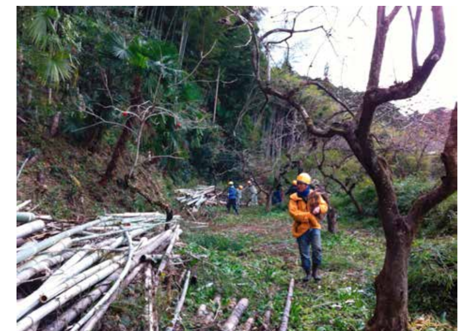
写真1：市民による竹林整備（紀美野町）

農林業の営みを通じた森づくり・里山の維持が難しくなった今日においては、農山村地域の自治体や住民、農林業関係者だけでなく、下流域で恩恵を受けている都市域の自治体や市民、企業などとの連携・協働による支援が問題解決の重要な鍵となっています。