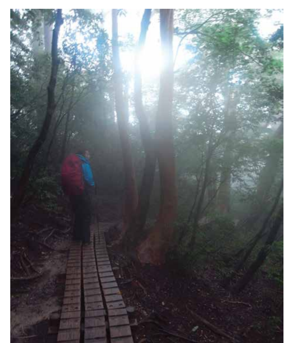
写真4：世界遺産・屋久島の木道