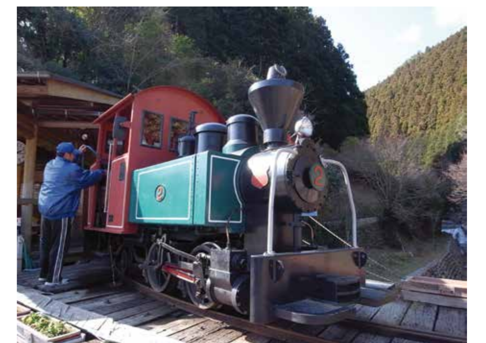
写真2：馬路森林鉄道（高知県馬路村）

大規模な産業の立地が難しい農山村にとって、豊かな自然を活かした観光は重要な産業のひとつです。しかし、過度の開発や観光客の集中は、自然環境に悪影響を与え、観光資源そのものの劣化につながります。環境保全・観光地利用・経済活動との適切なバランスを考える必要があります。