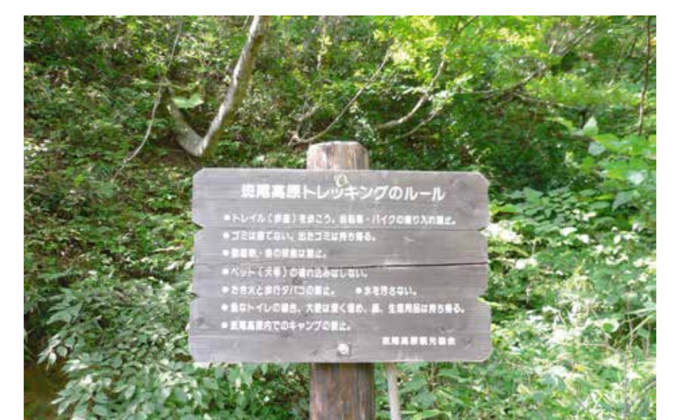
写真3：斑尾高原トレッキングコースの看板

ゼミ活動で得た知識と経験を基に、研究テーマの設定から研究計画、調査まで、学生ひとりひとりが主体的に行います。