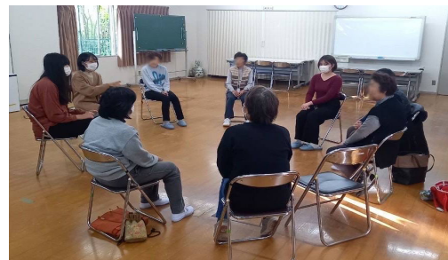
◁ヒアリング (2023年11月20日)

また、地域住民の方々の間でも住民同士のつながりが薄くなっていることを感じていらっしゃるようで、地域のリアルな現状を知ることができました。