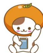
※本学マスコットキャラクター ターわだにゃん

和歌山大学交通アクセス http://www.wakayama-u.ac.jp/about/access.html