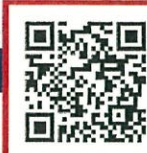
オンライン申込QR「Peatixサイト」

オンライン枠も別途実費が必要です。詳細はサイトでご確認ください。Peatixのリンク先をメール送付希望の方は、以下に必要事項を記載ください。