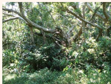
沖縄の新城(あらぐすく)島にすむキジムナーは、夜になると大きな牛の姿をして島の中を徘徊するという。古老の話では、写真の場所が、よく目撃されるポイントだとのことだったが、出会うことはできなかった。

本宮の各地では、頭が鬼で首から下が牛の姿をした魔物「牛鬼(うしおに)」が出たという。淵によく出るため、昔は日暮れ後には淵のある所を通らなかつたという。牛鬼を見て寝込んでしまい、頭がおかしくなつてしまつた人もいたそうだ。ここまでの話は、熊野の他の地でも聞かれる牛鬼の話とだいたい同じだが、今では無住地となつて野竹には、牛鬼は夜になる