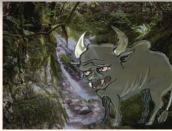
本宮の牛鬼(うしおに)は、淵や滝壺にすむという。だから、昔は日暮れ後には川には近づかないようにしていた。(イラストはBoBo)

おかしくなつてしまつた人もいたそう だ。ここまでの話は、 熊野の他の地でも 聞かれる牛鬼の話 とだいたい同じだ が、今では無住地と なつて野竹に は、牛鬼は夜になる