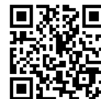
会場へのアクセス